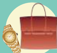
ブランド品・時計