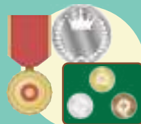
勲章・金貨 貨幣セット