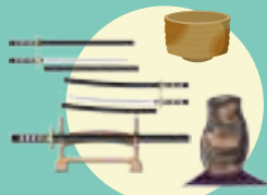
骨董品・刀剣・刀装具