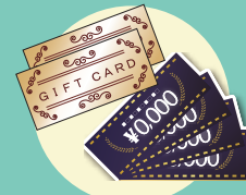
図書券・クオカード・金券 ※有効期限が3か月以上あるもの