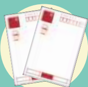
未投函ハガキ 年賀状・書き損じ等