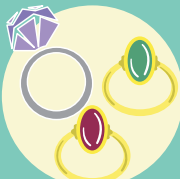
ダイヤモンド・宝石